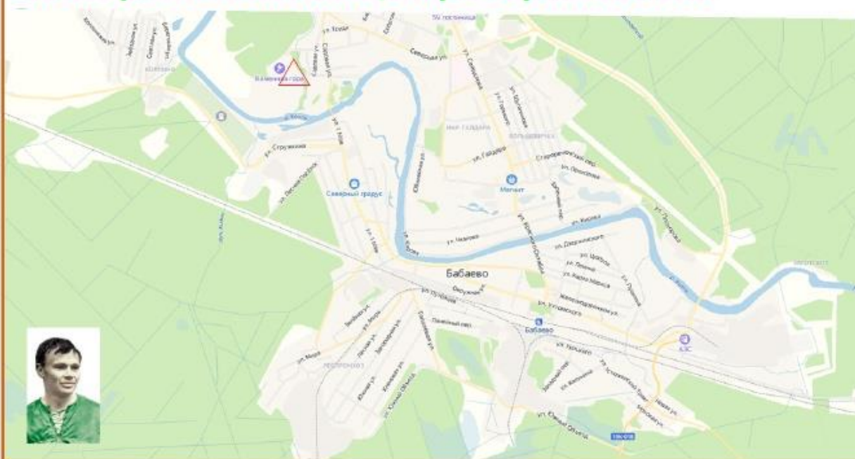
Схема расположения Центра соревнований