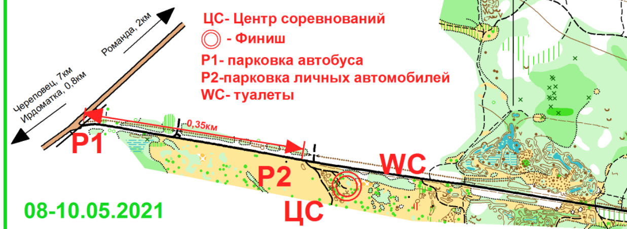
Схема Центра соревнований