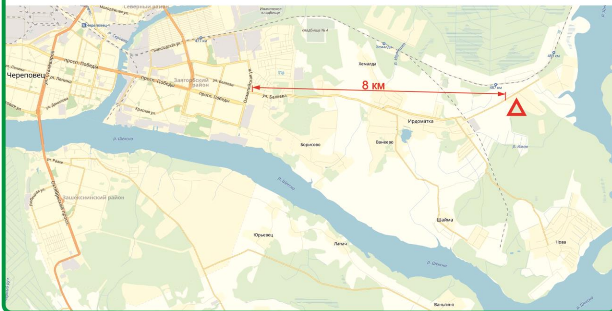
Схема проезда в Центр соревнований

GPS координаты Центра соревнований: 59.117246, 38.140317